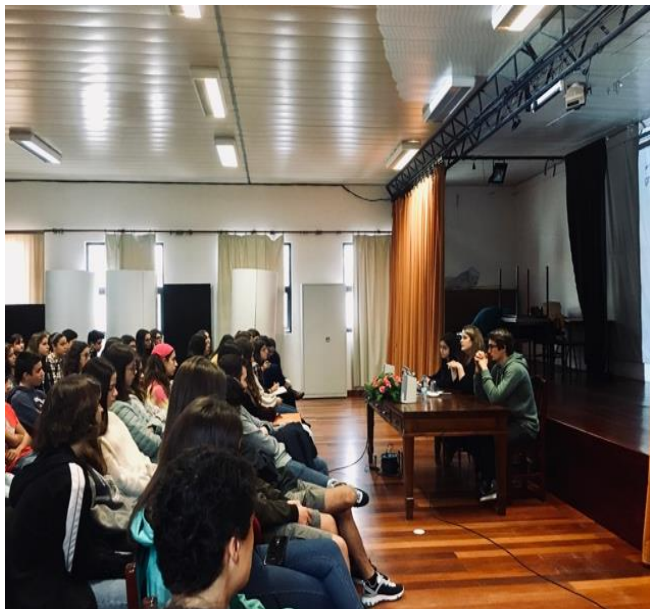
Sessão com um membro da APAV