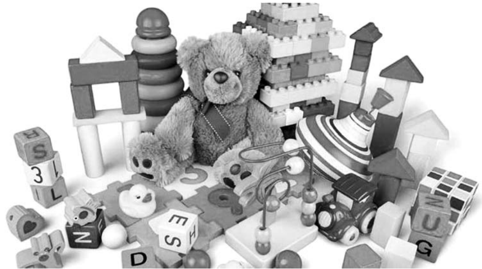
Lar da Mãe de Deus receberá doações da comunidade escolar

Esta campanha, que vai até ao dia 6 do mês de dezembro, decorrerá na escola. A população estudantil e docente e não docente, inclusiv os encarregados de educação, poderá contribuir