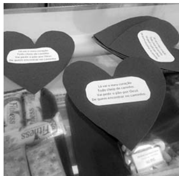
Atividades alusivas ao dia

Assim, apraz-nos assinalar o evento secular do “Pão por Deus”, que foi comemorado na nossa escola, no dia 30 de ou-