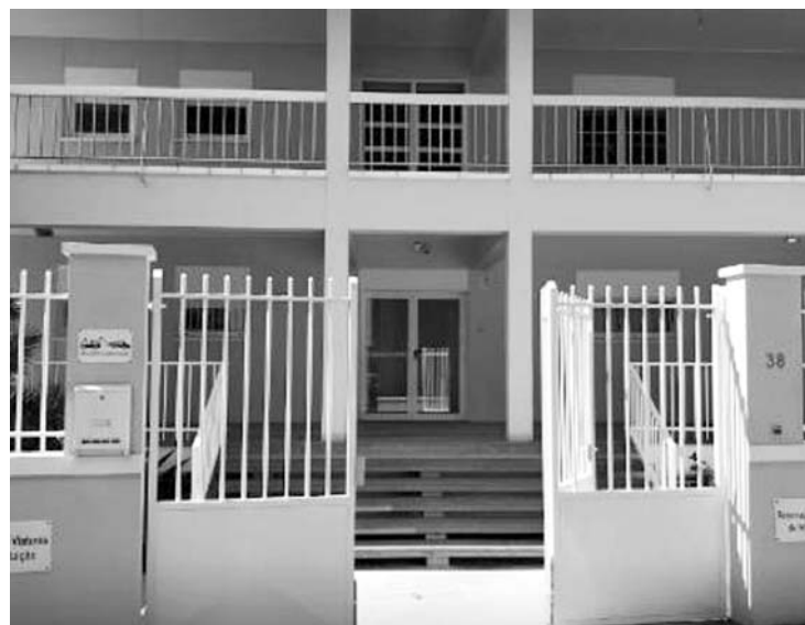
Recolha de artigos em pontos estratégicos da escola

deixando os artigos solicitados nos postos de coleta instalados na escola em pontos estratégicos.