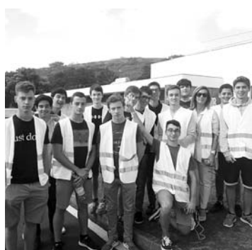
Alunos em visita à Musami

No passado mês de outubro, realizou-se, no âmbito da disciplina de Inglês, uma visita de estudo à Musami - Ecoparque de S. Miguel. Nesta atividade, participaram várias turmas do 11.º ano, com o objetivo de sensibilizar os alunos para a importância da preservação do ambiente e do desenvolvimento sustentável. Durante a visita, os alunos tiveram a oportunidade de conhecer