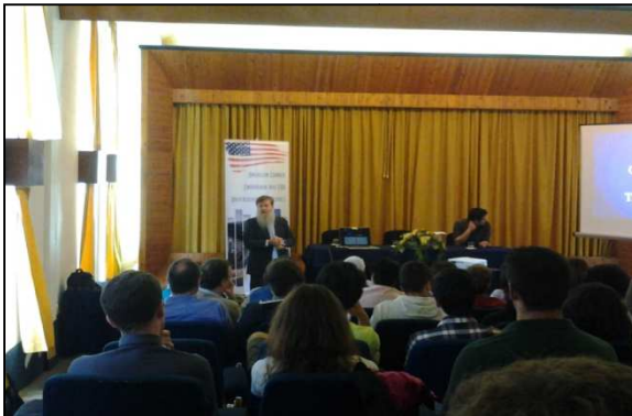
Christopher Jacobs (NASA)

Um grupo significativo de alunos da ESAQ (dos 10 o e 11 o anos de escolaridade) participou, no dia 22 de maio de 2015, pelas 14h30 min, na palestra Stellar "GPS": Navigation in the Solar System , na Universidade dos Açores.